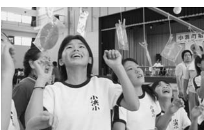
小学生もチャレンジ!