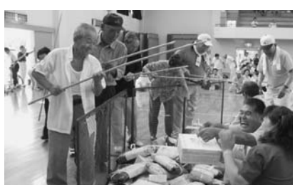
大物が釣れた! 宝つり競争