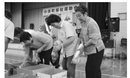
ルールは袋に入れるだけ詰めてOK パーゲンセール