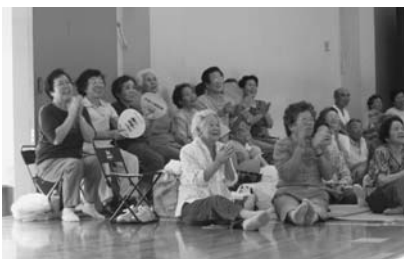
応援にも熱が入ります!