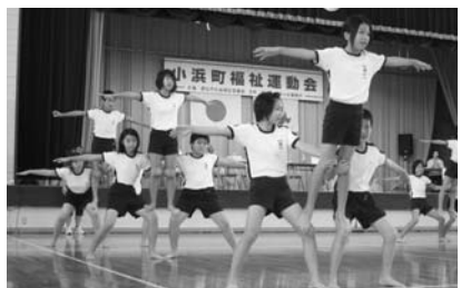
会場から大きな拍手が送られました