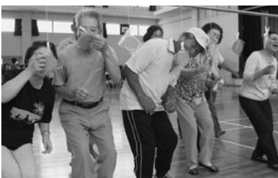
これぞ小浜名物!“湯せんぺい食い競争”