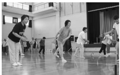
狙いをさだめて... “それっ!”

9月15日(土) 雲仙市小浜体育館にて、平成19年度小浜町福祉運動会が開催されました。軽スポーツを通して、参加者の身体機能及び体力の維持と参加団体間の理解と交流を深めるとともに、地域福祉の向上を図ることを目的に、老人会や福祉団体などから約600人が集まりました。玉入れや小浜ならではの「湯せんぺい食い競争」などの種目で皆さんいい汗をかいておられました。