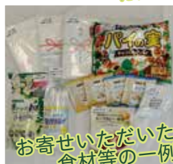
お寄せいただいた 食材等の一例