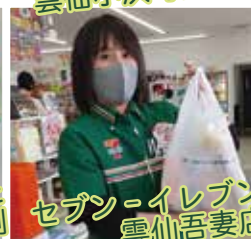
セブン-イレブン 雲仙吾妻店