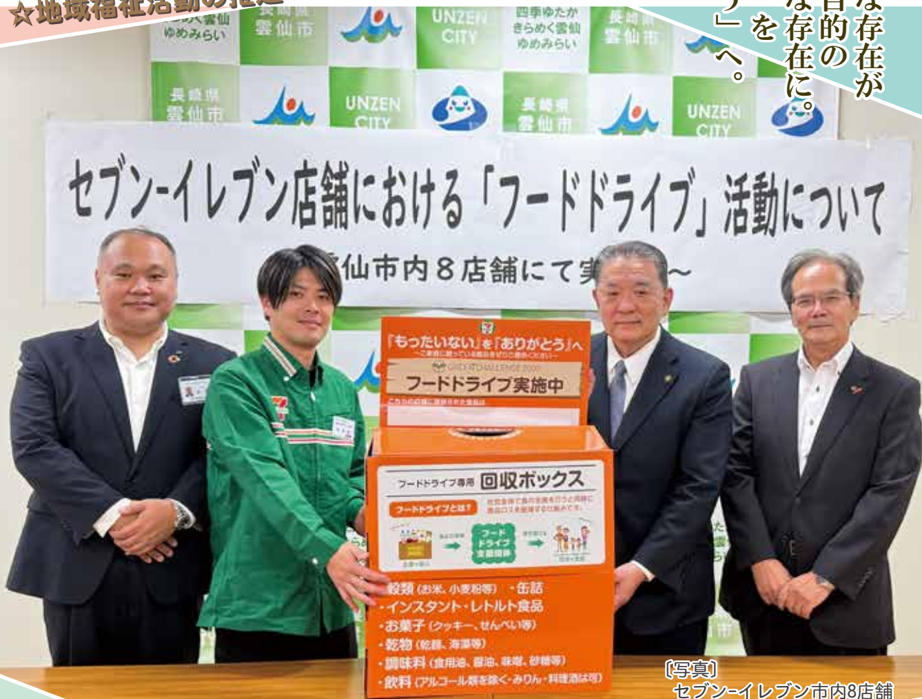
〔写真〕 セブン-イレブン市内8店舗 フードドライブ活動記者発表

「もったいない」「ありがたい」を 「コンビニエンスな存在が 寄附や地域貢献目的の 買い物目的の」へ。