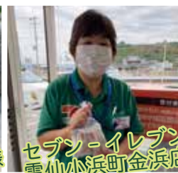
セブン-イレブン 雲仙小浜町金浜店